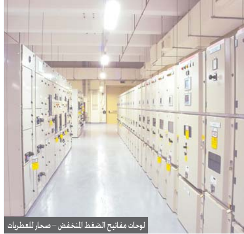
لوحات مفاتيح الضغط المنخفض - صحار للطعربات