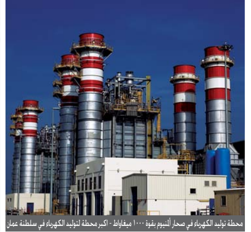
محطة توليد الكهرباء في صحار للنيوم بقرعة ١٠٠٠ ميفاط - أكبر محطة لتوليد الكهرباء في سلطنة عمان