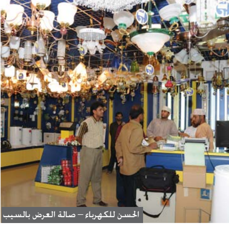
الحسن للكهرباء - صالة العرض بالسبب