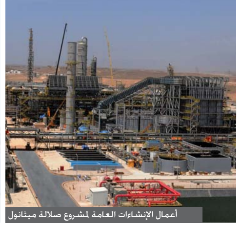
أعمال الإنشاءات العامة لمشروع صلالة مينانول