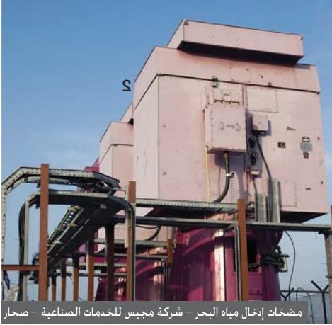
مضخات إدخال مياه البحر - شركة مجيس للخدمات الصناعية - صحار