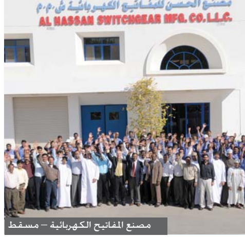
مصنع المفاتيح الكهربائية - مسقط