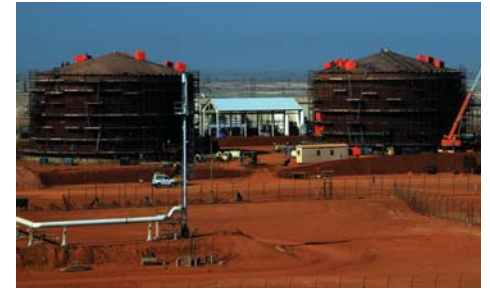
مشروع مولدات البخار لمعالجة الحرارة لصالح نيم / أكسيدينتال مخزنة دبي لاند - ٢ مشروع المحطة المساعدة لصالح هيئة دبي للكهرباء والمياه / سيمينز